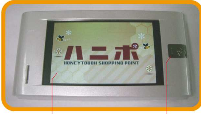
■ 4.3 インチタッチパネル液晶 ■ ICカードリーダー