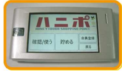
■ メインメニュー画面